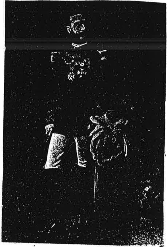
El Rey Alfonso XIII

Verdad es que fue una etapa de paz y prosperidad para España pero la democracia y la libertad eran palabras prohibidas.