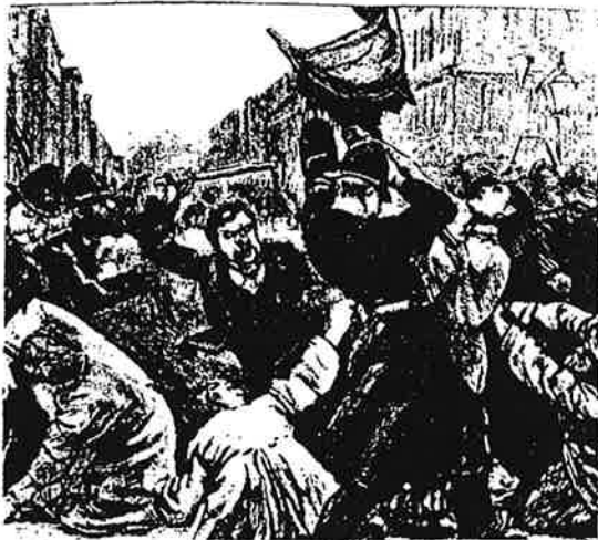
El sexenio revolucionario.

En la derecha, el aspecto político de aquel tiempo estaban los Alfonsinos, monárquicos y comandados por Cánovas del Castillo que fueron los que más se movieron por hacer volver al hijo de Isabel II, Alfonso XII. Esta labor se vio acelerada, ya que el ejército se pronunció en Sagunto de manos del general Martínez Campos en diciembre de 1874 acabando el sexenio revolucionario y dando lugar al inicio de la Restauración Borbónica , una nueva esperanza.