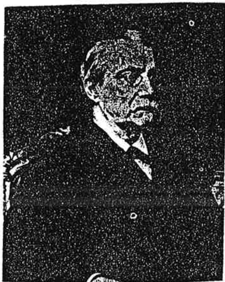
Cánovas del Castillo

nización del sistema, realizadas por Cánovas, y la pacificación nacional. Esta pacificación, que es el aspecto más positivo de este régimen, se realizó poniendo fin a la Tercera Guerra Carlista en -